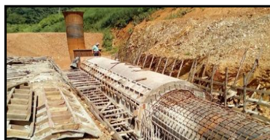
กิจกรรมท่อส่งน้ำ