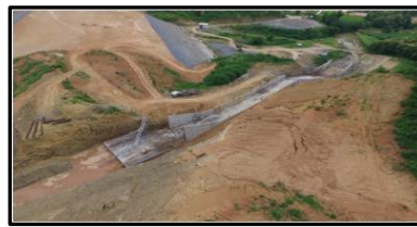
งานอาคารทางระบายน้ำล้น