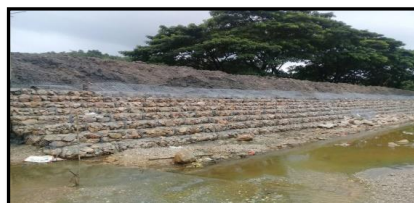
งานเรียงกล่องลวดตาข่าย