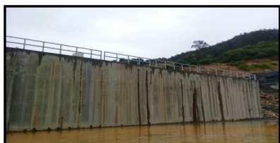
งานราวสะพานกันตก