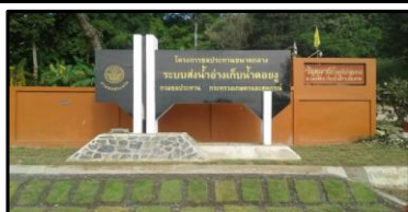
ป้ายโครงการ