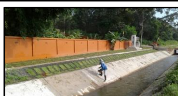
งานปลูกหญ้า