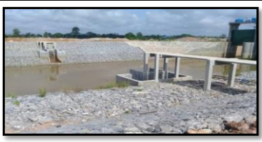
ทรบ.ปากคลองฝั่งขวา-ซ้าย