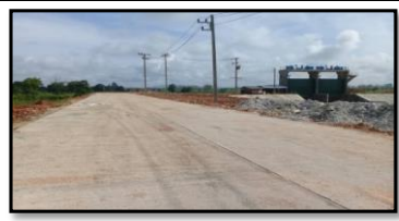
งานถนนคอนกรีตเสริมเหล็ก